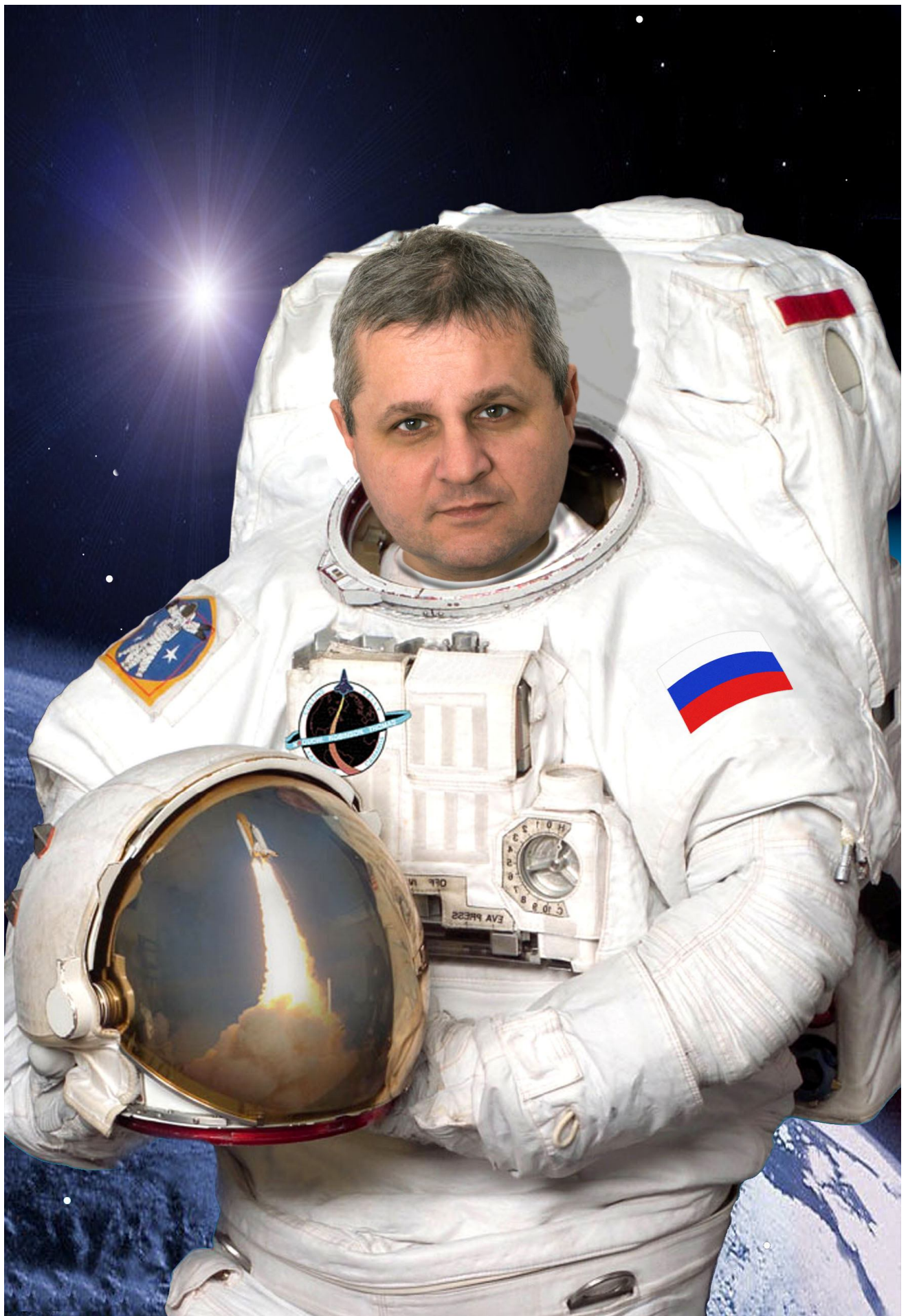
L una * O leg * V ladimirovich * E rmakov