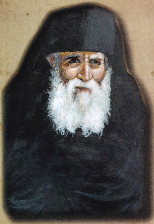
Преподобный Паисий Святоторец (Арсений Эзнепидис) (1924-1994)