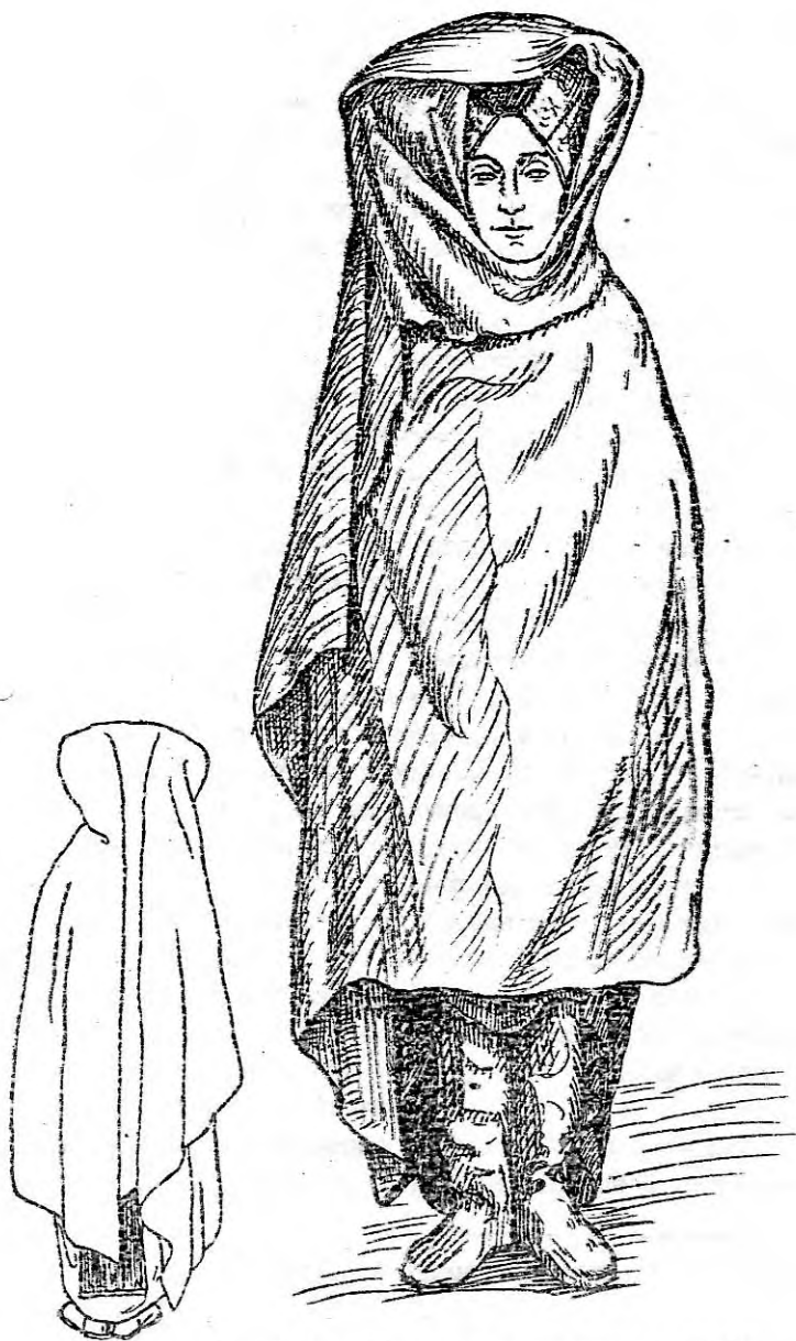
Рис 1. Андийка в традиционном костюме