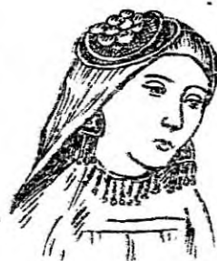
Рис. 2. Традиционные головные уборы (чухта)