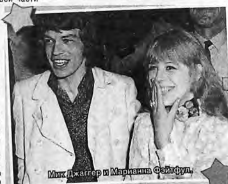
Мик Джаггер и Марианна Фэйтфул

Мик названивал ей каждый день, и очень скоро Марианна решила, что это судьба. Рождество 1966 года они впервые провели вместе: она переехала к Микку, украсила его дом коврами из Марокко, и жизнь стала похожа на разноцветное колесо, которое катится куда-то за горизонт и не думает останавливаться.