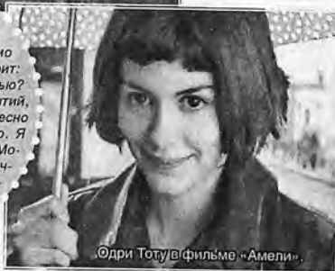
Одри Тоту в фильме «Амели».

след простыл. Актёр исчез по-английски, не прощаясь. Он слышал каждое слово, произнесённое Одри. Через некоторое время после несчастного интервью Одри Тоту взяла отпуск и уехала из Парижа. Никто не может с точностью ничего утверждать об их отношениях. Да и вообще ничего о личной жизни Одри. «Когда дело касается моей личной жизни, я — могила», — заявила как-то в интервью актриса. Так что любопытным остаётся только догадываться о возможных романах этой загадочной напад Тоту.