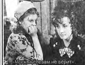
«Москва слезам не верит».

Сюжет. На борту только девушки! Девацкий экипаж «Циклона» составляют четыре красавицы: Оля, Галя, Валя и капитан буксира Люба. Они хотят доказать родителям свою самостоятельность и готовность к службе на гражданском флоте. Родители, напротив, пытаются показать дочерям, что это не женское дело и специально устраивают им всякие трудности, например, назначение на старый разваливающийся буксир, ограничение в продовольствии. Но эти происки ничуть не омрачают девушек по поводу выбора профессии. Тем временем молодой журналист Женя командирован в морской порт на практику. Его «внедряют» коком в команду буксира «Циклон». После появления мужчины на