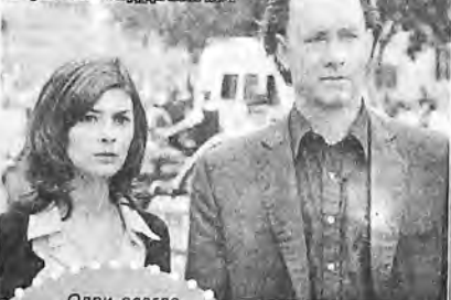
Одри Тоту и Том Хэнкс в фильме «Код да Винчи».

Одри всегда фотографирует своих интервьюеров на память. Они ей интереснее, чем само интервью. Зачастую она говорит: «Может, не надо этого интервью? Знаете, никаких особенных событий, о которых кому-то было бы интересно знать, со мной не происходило. Я живу обычно и благополучно. Может, даже слишком благополучно. Я какая-то среднестатистическая, малоинтересная европеяка...»