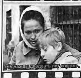
«Однажды двадцать лет спустя».