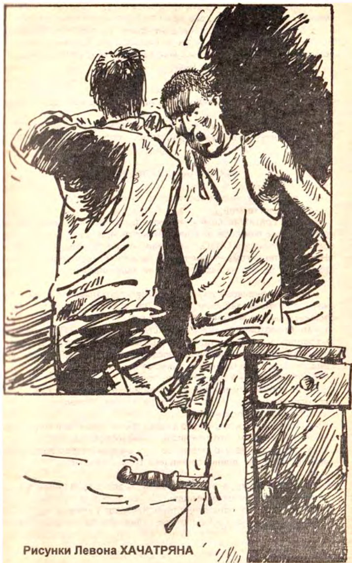
Рисунки Левона ХАЧАТРЯНА