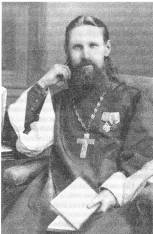
Святой праведный Иоанн Кронштадтский