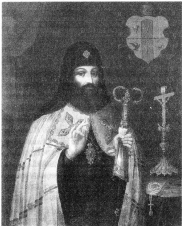
Митрополит Петр (Могила)