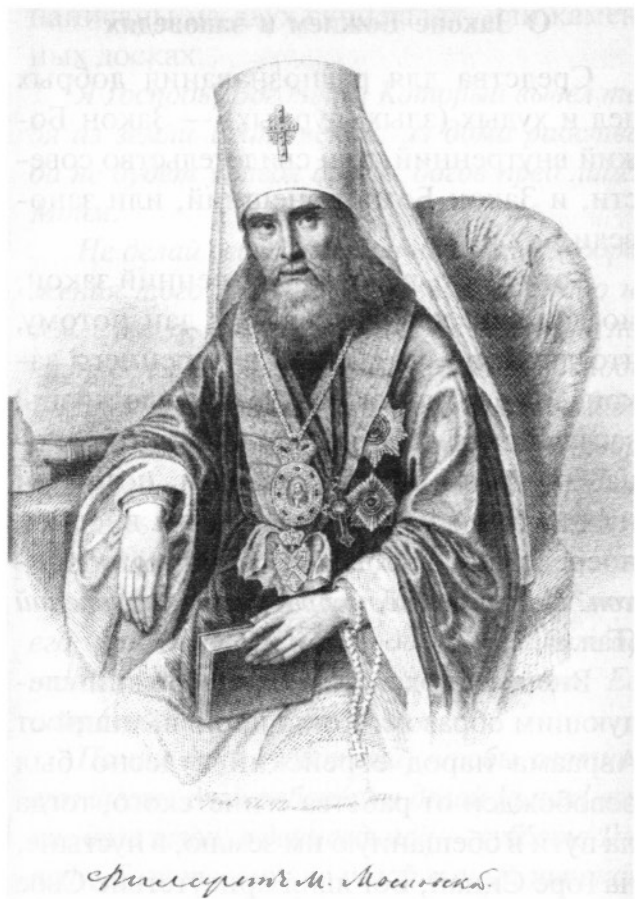
Святитель Филарет, митрополит Московский