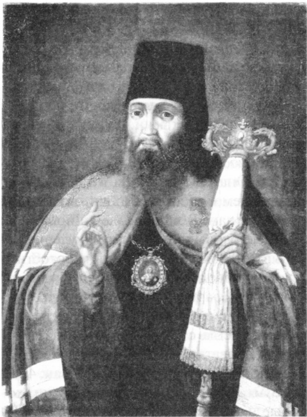
Святитель Тихон Задонский