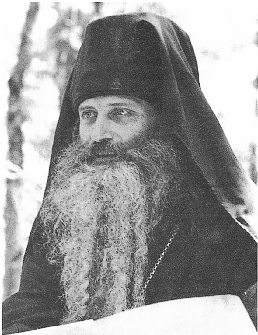
Иеромонах Серафим (Роуз) 1934–1982