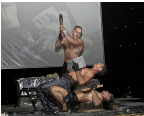
«Самсон» учит молодых авторов, как нужно разбираться с критиками