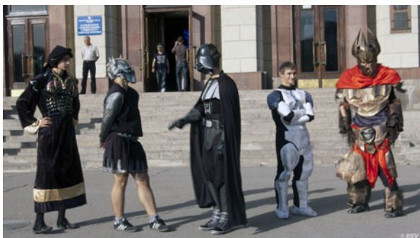
На входе в Северный корпус ХНУ участников ЗМ встречали фантастические персонажи

На этот раз, вместо привычного нашествия инопланетян, открытие приняло форму губернского бала