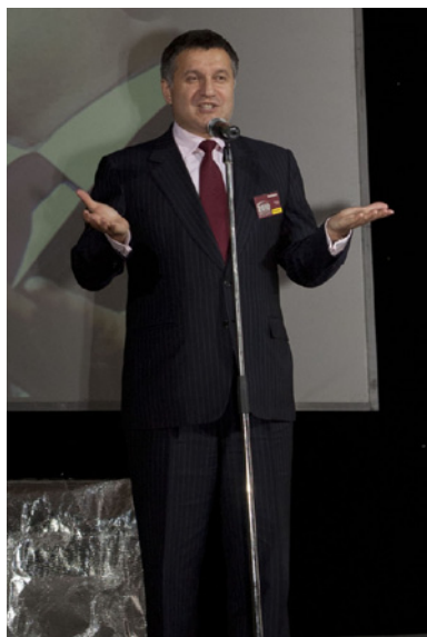
Сопредседатель Оргкомитета Арсен Аваков поздравил собравшихся

из эквилибристики на башне из стульев, поднявшейся под самый потолок, и выступления днепропетровского клуба «Самсон» с разрыванием цепей, разбиванием шлакоблоков, ломкой деревянных брусьев о пузо и прочими традиционными силовыми забавами. Судя по женским охам, ахам и даже членораздельным возгласам и комментариям, зрелище впечатлило, что и подтвердилось впоследствии при проведении опроса.