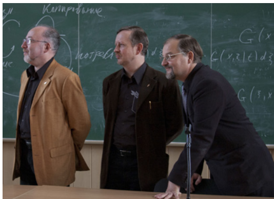
Диспут «Любой гасконец с детства академик» прошёл весьма оживлённо, и ведущие, похоже, остались довольны

В субботу утром в качестве разминки перед второй частью «Олди и компании» состоялась презентация журналов «Очевидное и невероятное» и «Шаги». Пикантность ситуации заключалась в том, что «Очевидное и невероятное» презентовала нынешний редактор, а в зале присутствовал редактор прежний. После