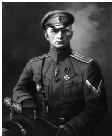
М. Г. Дроздовский

«А, в общем, страшная вещь гражданская война; какое озверение вносит в нравы, какую смертельную злобой и местью пропитывает сердца; жутки наши жестокие расправы, жутка та радость, то упоение убийством, которое не чуждо многим из добровольцев. Сердце моё мучится, но разум требует жестокости. Надо понять этих людей, из них многие потеряли близких, родных, растерзанных чернью, семьи и жизнь которых разбиты, имущество уничтожено или разграблено и среди которых нет ни одного, не подвергавшегося издевательствам и оскорблениям; надо всем кадит теперь злоба и месть, и не пришло ещё время мира и прощения...»