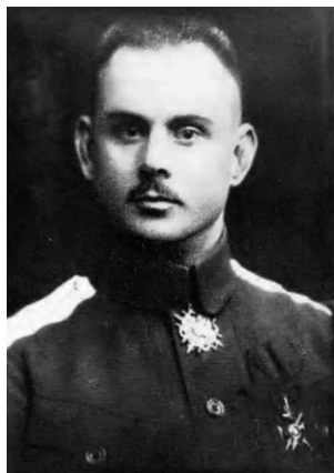
В. М. Чернецов

Партизанский отряд есаула Чернецова был образован 30 ноября 1917 года. Он состоял в основном из юнкеров — курсантов артиллерийских училищ и примкнувших к ним многочисленных представителей донского казачества, настроенных против Советской власти. На этом этапе отряд Чернецова являлся чуть ли не единственной военной силой генерала Каледина, взявшегося за формирование «Добрармии». Казалось бы, какие-то 200 сопляков, возмнивших о себе как о героях-освободителях России. Сам Чернецов не достиг еще и 30 лет. Но эти «сопляки» залили кровью весь свой путь продвижения по придонским областям: только на Ясиновском руднике было расстреляно 118 человек, на