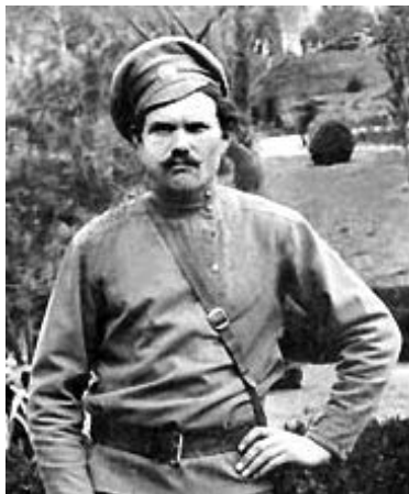
Ф. Г. Подтёлков

– Не дам!.. Сказано: не дам! Ну, и все! Революционным судом его судить и без промедления наказать. Чтоб и другим неповадно было!.. Ты знаешь, – уже спокойней проговорил он, остро взглядываясь в при-