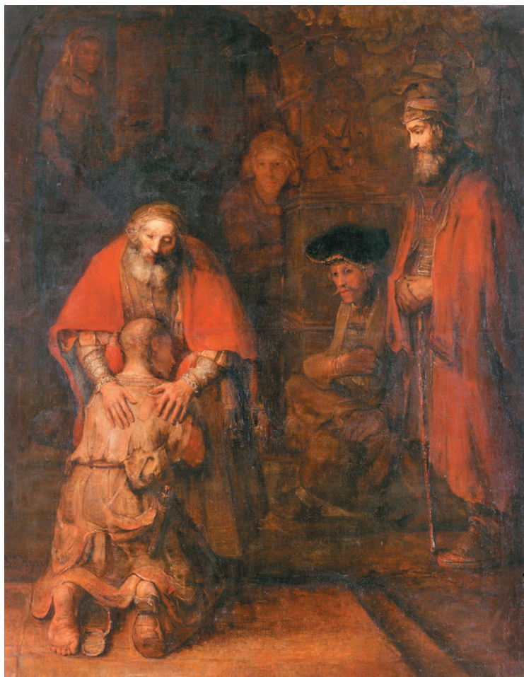
Рембрант ван Рейн. «Возвращение блудного сына»

” ТАК ЧАСТО БЫВАЕТ С МОЛОДЫМИ ЛЮДЬМИ, ИМ КАЖЕТСЯ, ЧТО ВСЕ У НИХ ПОЛУЧИТСЯ, И РОДИТЕЛИ УЖЕ НЕ НУЖНЫ.