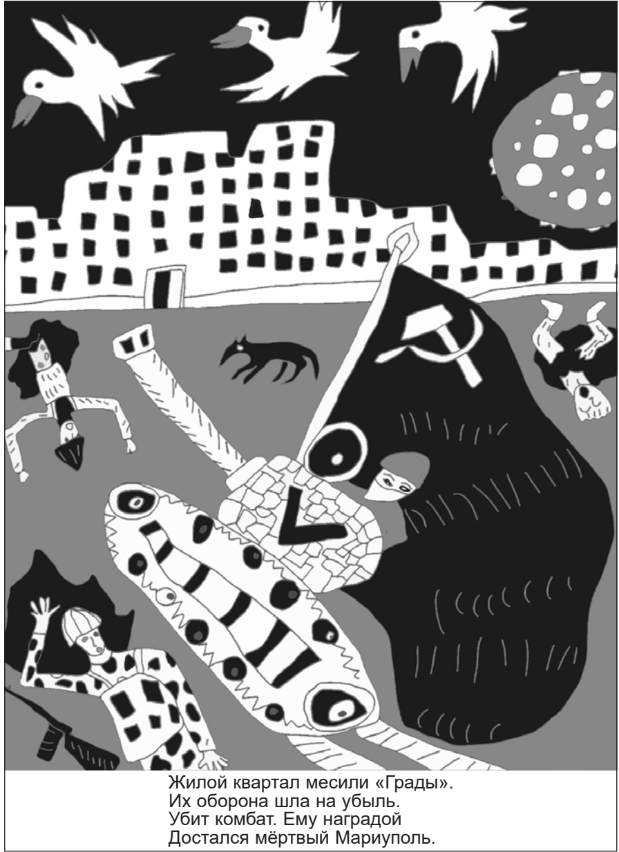
Жилой квартал месили «Грады». Их оборона шла на убыль. Убит комбат. Ему наградою Достался мёртвый Мариуполь.

Лощинин не ответил. Он смотрел на памятник, черневший среди ночного неба. Над ним летели белые туман- ные огни, и взодзата рука махала им, провозгласила. И вдруг он понял, что это памятник Пушкину, тому, молодому, что читает стихи, воздев возмущен- ную руку. Это ошеломило его. Он плохо знал Пушкина, не помнил его стихов, только несколько строк, про "мороз и солнце" и про "чуждое мгновение". Но Пушкин на этой мёртвой площади с лежащими мертвецами, осыпавый ворохами трассеров, под текущими ка- раванами смертоносных огней, Пуш- кин вдруг приподнял его лёгкой рукой и перенёс в морозный солнечный день, где парты с раскрытыми книгами, учи- тельница Анна Васильевна в вязанной кофте, её милое взволнованное лицо.